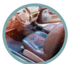
Sido- och handskfack