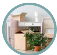
Lådor & förvaring