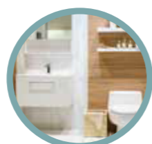
Badrum, toalettskåp & hyllor