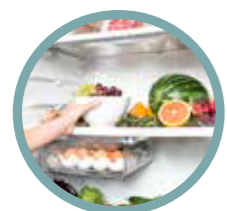
Kylskåp, frys & skafferi