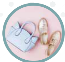
Skor & handväskor